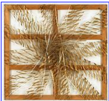
Carla Accardi 1972. Punto con raggi. Finestra sulla realtà

Per giungere ad una descrizione razionale dell'ambiente, occorre che il soggetto passi da una descrizione soggettiva ad una che potremmo dire intersoggettiva: occorre cioè che il soggetto si sforzi di porsi nella situazione di altri osservatori, oppure immagini di guardare o manipolare un oggetto in vari modi. Ci si avvia così ad una descrizione tale che un oggetto o un ambiente possa essere riconosciuto da molti osservatori; l'ideale sarebbe che la descrizione potesse far riconoscere un oggetto da ogni osservatore; e ciò si ottiene quando si giunga a formulare la definizione logica dell'oggetto in parola.