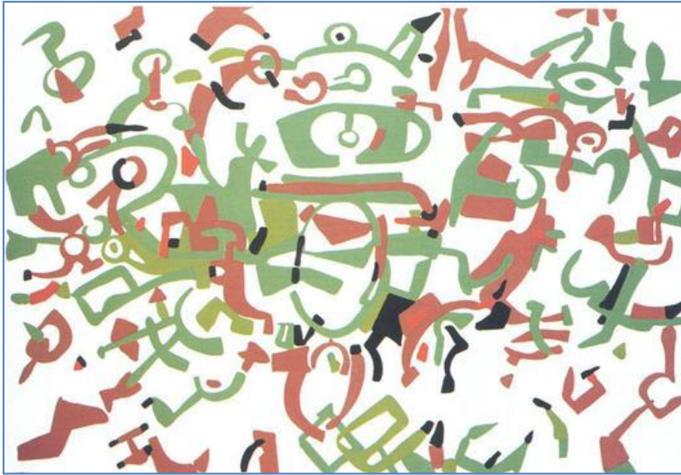
Carla Accardi (1954). Frammenti

Tuttavia, nella pratica abituale, quando si tratta di enti della geometria elementare, si usano ordinariamente dei disegni, che ci richiamano le immagini da cui i concetti sono stati formati. A questo proposito ricordiamo ancora una volta che non le immagini, e meno ancora i disegni, sono in grado di fondare una deduzione valida, ma soltanto i concetti rigorosamente definiti. Ci si potrebbe quindi domandare quale sia il