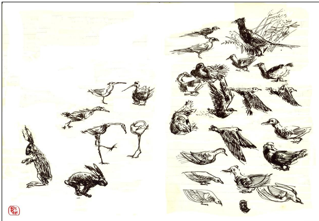
A.Mazzotta. Dare un nome....( 1 )

Nel campo intellettuale la ricerca della certezza della conoscenza è sempre stata la spinta della mentalità scientifica: l'uomo non si accontenta di sapere che le cose stanno in un certo modo. Egli vuole anche sapere perché le cose sono così e non altrimenti, perché vuole dominare non soltanto il fatto bruto della situazione esistenziale ma anche, e direi soprattutto, le radici di questo fatto. E le radici sono di due specie: una è la radice intellettuale, nel senso che l'uomo vuole cercare di capire, di dimostrare, di conoscere le ragioni del mondo e delle cose da lui conosciute. L'altra è nel mondo dei fatti, della potestà costruttiva, del dominio dell'essere e dell'esistere, proprio ed altrui. Discende di qui che la ricerca del dominio dell'uomo sul cosmo va in due direzioni: la ricerca del sapere, nelle sue radici, e la ricerca del fare, del costruire, del dominare, del comandare il resto del mondo. Entrambi desideri legittimi, se è vero che Dio fece sfilare gli animali davanti ad Adamo, perché egli "imponesse a ciascuno un nome".